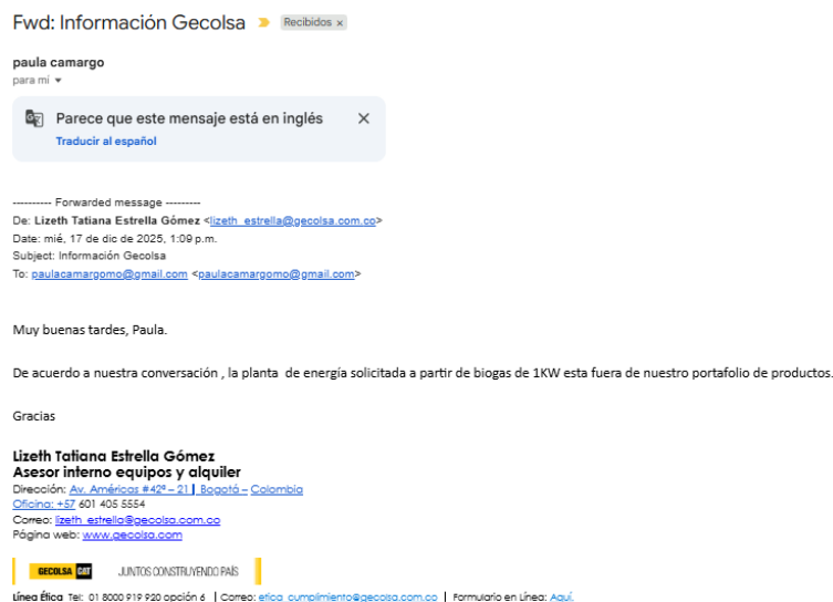
Imagen 3. Información suministrada por correo electrónico de la empresa Gelcolsa.