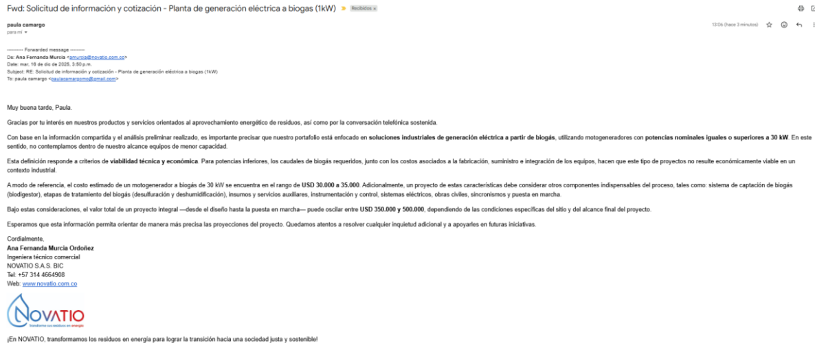
Imagen 1. Respuesta técnica de la empresa Novatio.

Este anexo contiene la evidencia de las consultas realizadas a los proveedores especializados Novatio y Gelcolsa, donde se especifican las capacidades mínimas de generación y los costos base de los equipos.